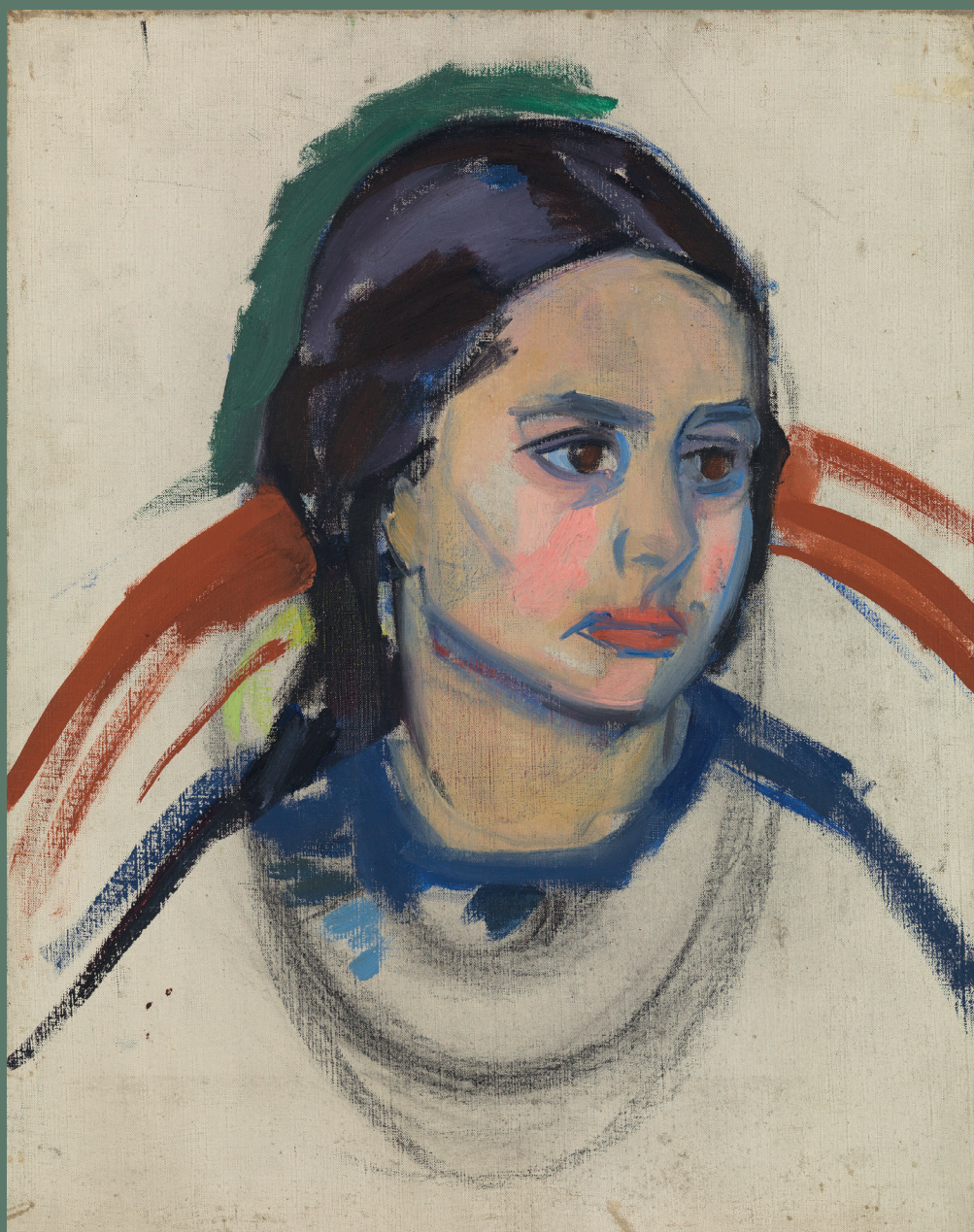
»Porträt eines Mädchens« von Olga Meerson, um 1915, Öl auf Leinwand, aus dem Ausstellungskatalog »Die Malerin Olga Meerson«, Schloßmuseum Murnau (Hg.), Langemann & Langemann, 2025